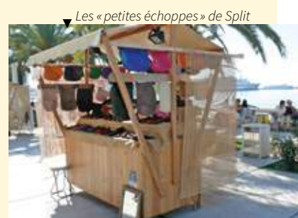
▼ Les « petites échoppes » de Split