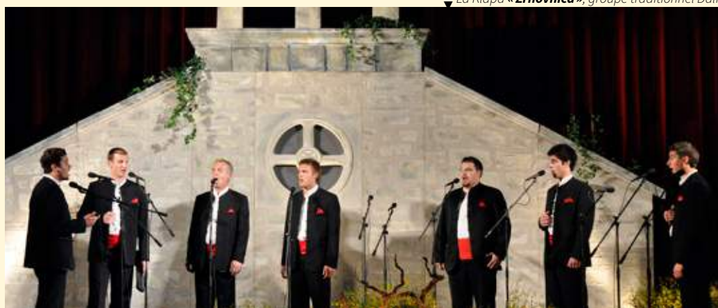
▼ La Klapa « Zrnovnica », groupe traditionnel Dalmate

Site de l'organisation croate : www.cronaves.com