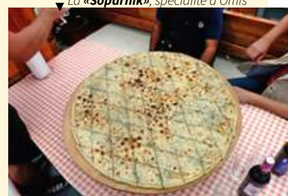
▼ La « Soparnik », spécialité d'Omis