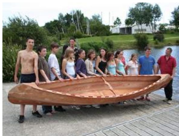
« Skims » finis