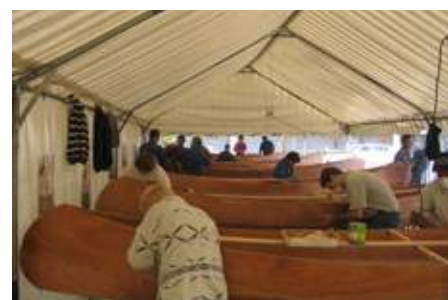
« Canoë Caïman »