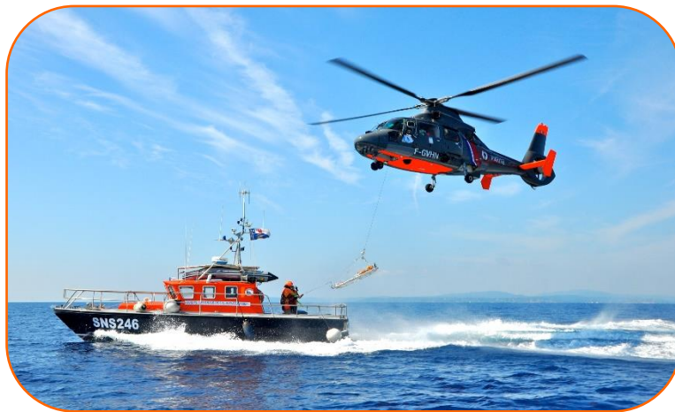
Exercice de Sauvetage – L'Esterel

D'autres informations seront communiquées lorsque la date de la journée du Sauvetage sera déterminée.