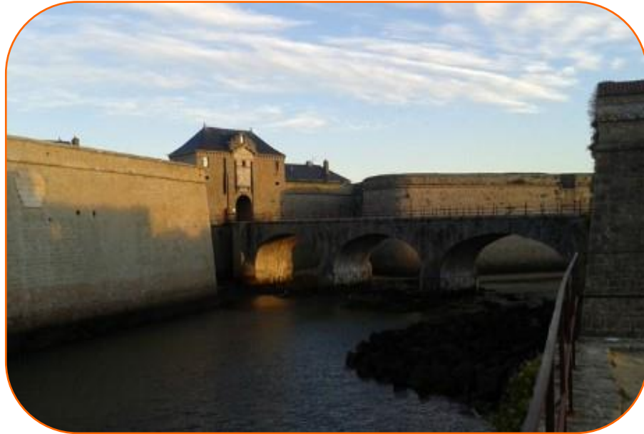
Le musée de Port-Louis

En complément de son exposition permanente sur l'histoire du sauvetage, le Musée de la Marine de Port-Louis dans le Morbihan propose une exposition temporaire sur le sauvetage actuel.