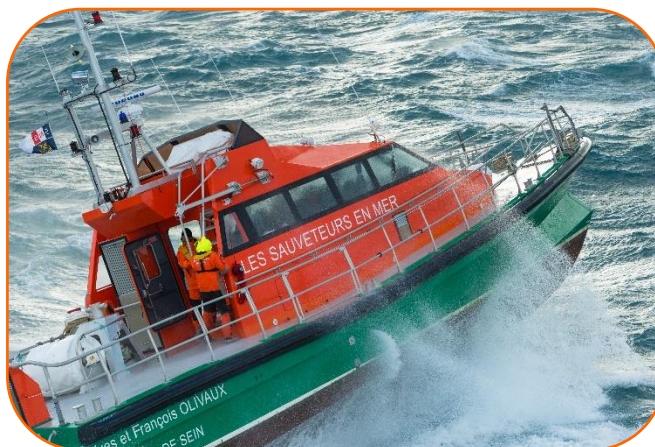
Canot Tous Temps Nouvelle Génération - SNS 001 « Yves et François Olivaux », Ile de Sein