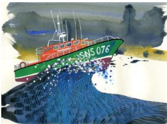
Visuel présenté lors du Nautic 2016

Le visuel a été spécialement réalisé par le Peintre Officiel de la Marine, Nicolas Vial , et découvert pour la première fois lors du NAUTIC en décembre 2016 .